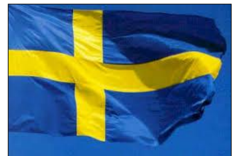
Hej då Sverige