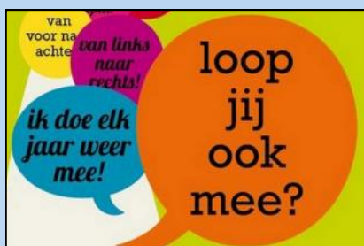
Van 7 t/m 10 juni: de 12e Rooise Avond4daagse