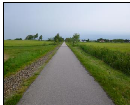
Meseta van het Noorden

Om half acht ontbijt ik al, iets over achten neem ik afscheid, loop door het park en kom ik weer op de oude treinbaan naar Skottorp. Er is weer veel wind, nu staat die op de kop. Deze baan ligt iets lager dus iets meer beschuttend voor de wind. Het is droog maar er is