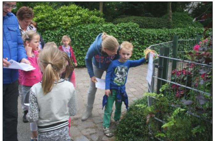
Voor kinderen is er een puzzelzoektocht op de 5 km-route

Kijk ook eens op www.avondwandelvierdaagse-sint-oedenrode.nl