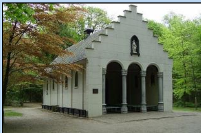
Zondag 29 mei: 1e OLAT Dauwtrap- tocht naar de kapel van de H. Eik