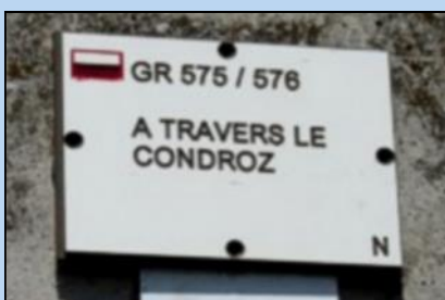
Op 4 juni gaat de clubreiswandering over de GR 576 in de Condroz